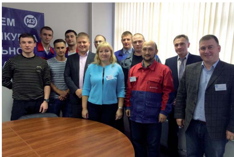
Производственные мастера и представители жюри конкурса профмастерства

16 сентября на Ижорских заводах состоялся конкурс профессионального мастерства среди рабочих и мастеров в номинациях «Лучший производственный мастер», «Лучший электросварщик ручной сварки» и «Лучший электросварщик на полуавтоматических и автоматических машинах».