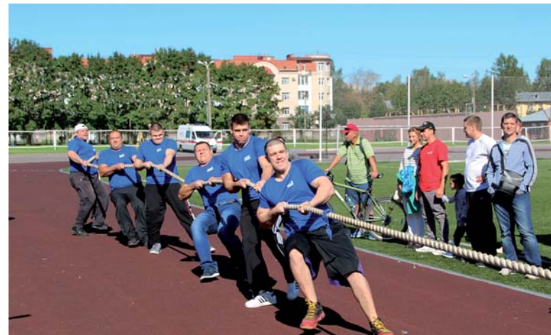
Богатыри из ОМЗ безоговорочно взяли верх в перетягивании каната