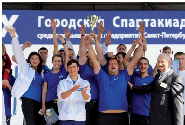
Наши чемпионы с кубком на первой ступени пьедестала почета

Первые выходные осени по традиции ознаменовались празднованием Дня рождения города Колпино и Ижорских заводов.