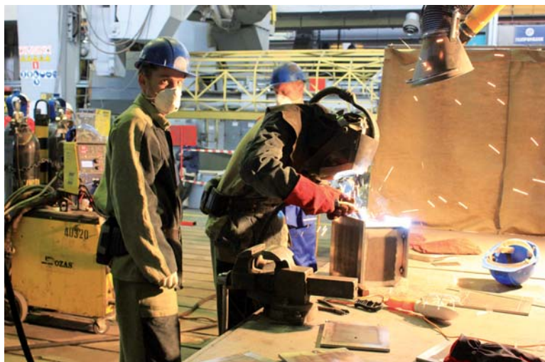
Сварка контрольного изделия – один из практических этапов конкурса для электросварщиков