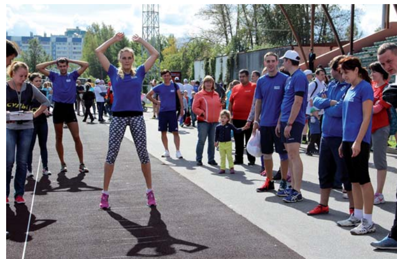
Команда ОМЗ победила в соревнованиях по тройному прыжку

городская колонна, посвященная году кино в России, произвела очень приятное впечатление на руководителей района и гостей праздника. Впрочем, главное то, что остались довольны жители Колпино, которые с удовольствием фотографировали ижорцев, и сами наши работники, пришедшие на праздник. Ведь праздник в первую очередь организовыва-